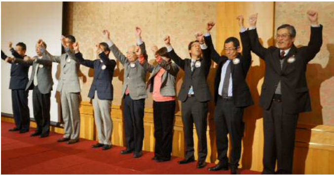
アテンダンス・アワード