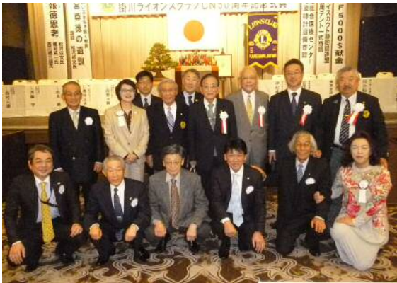
掛川LC50周年記念式典