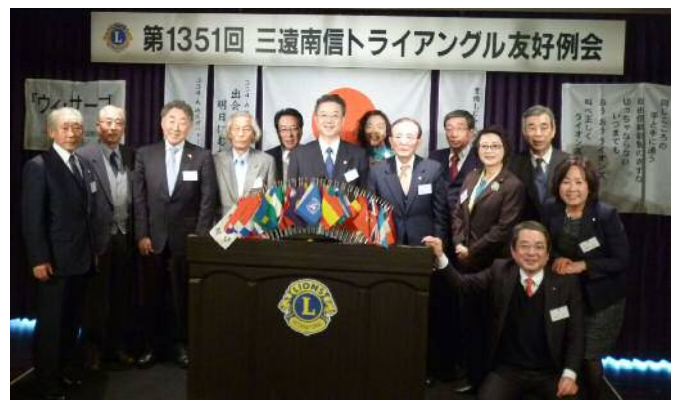
三遠南信トライアングル友好例会