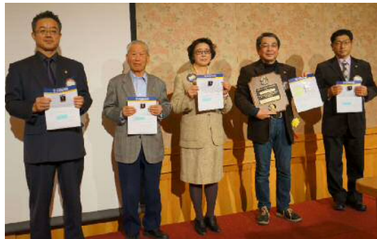
MJF 献金協力者へピンと楯贈呈