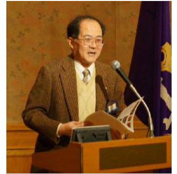
副TT矢部LによるTTタイム