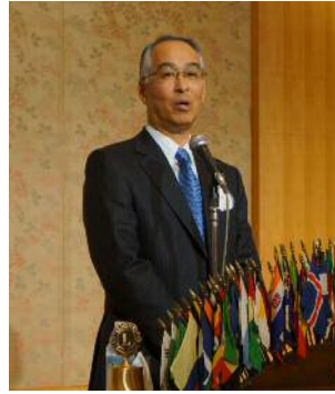
小國神社 打田宮司 講演