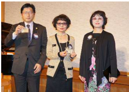
ゴールドカード認定証授与