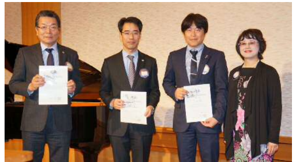
薬物乱用防止教育認定講師認定証授与