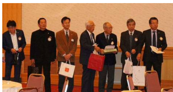
曲に合わせてプレゼント交換