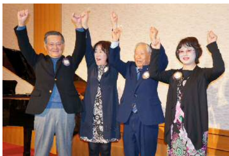
アテンダンス・アワード