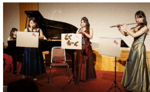
木管四重奏 「木ちゃん」による演奏会