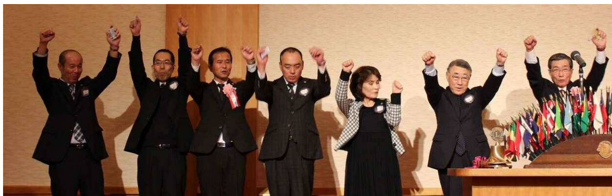
薬物乱用防止教育認定講師 認定証 伝達