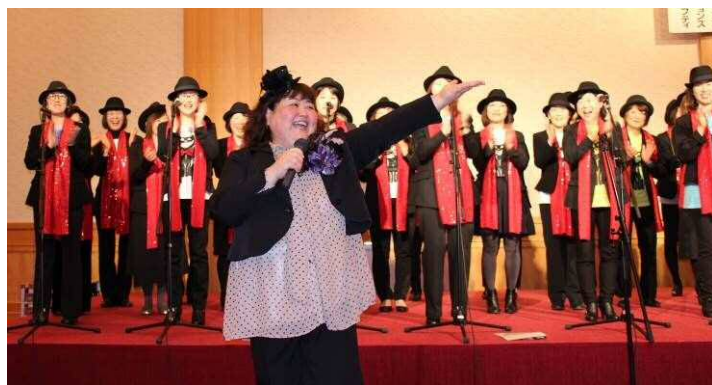
ポイントオブ浜松ゴスペルクワイアの迫力のコンサート