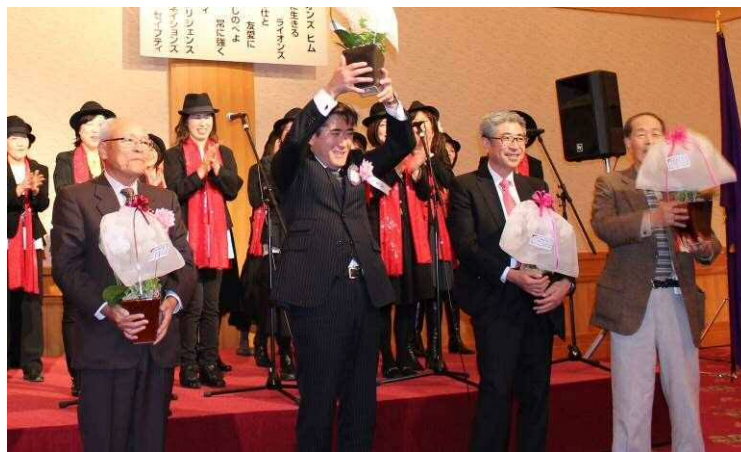
happy Birthday!! ゴスペルクワイアの皆さんが大合唱でお祝い。