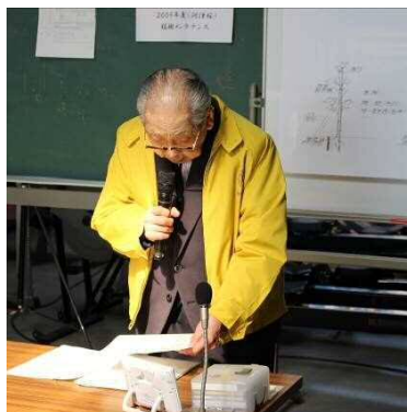
大久保指名委員長より次期役員指名