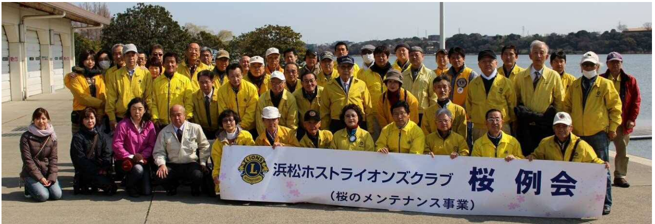
佐鳴湖湖岸 桜木メンテナンス 作業風景