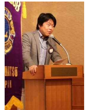
司会の板山計画委員長