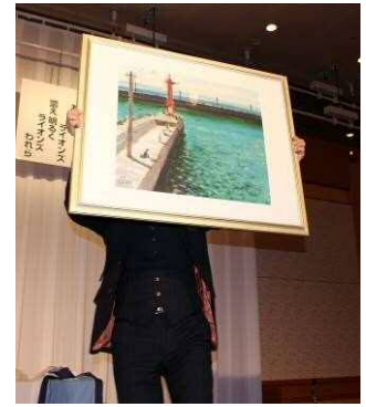
オークション 絵画