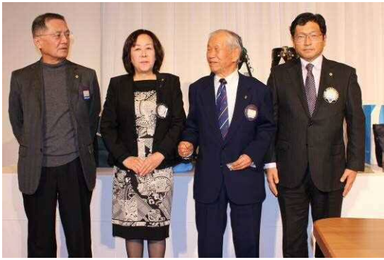
アテンダンスアワード 受賞者