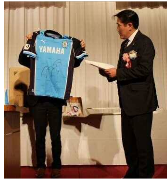
オークション ズレロホーム