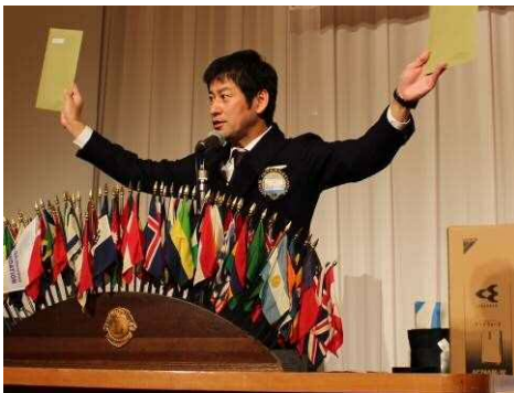
オークション オークホリル 宿泊券