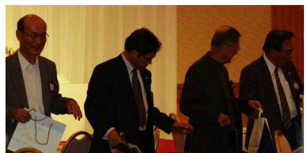
童心にかえてプレゼント交換