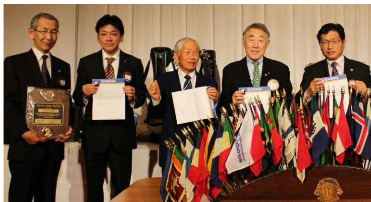
11月MJF献金者へピンと楯の贈呈