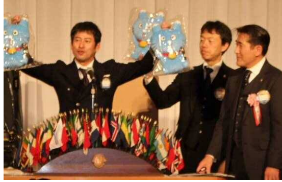
オークション ゆるきゃら しずなび