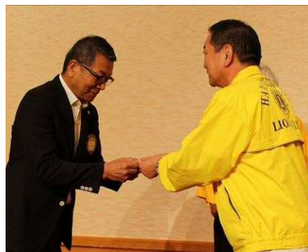
アソシエイトの贈呈