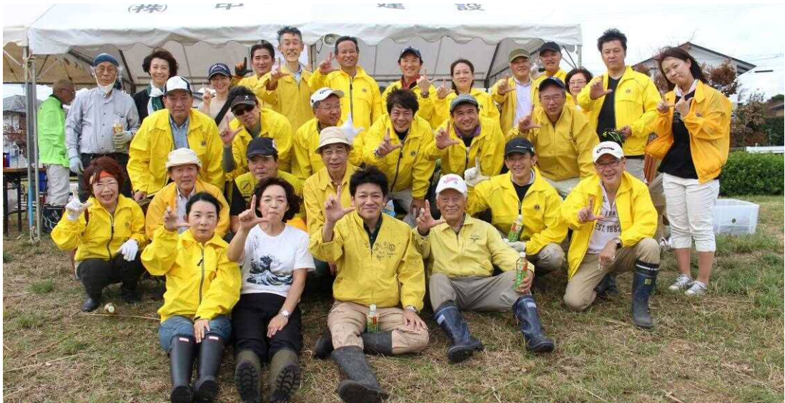
暑い中 準備に、ヨシ刈りに、清掃にと汗を流しました。お疲れ様でした。