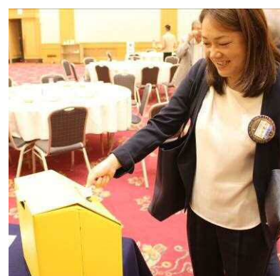
北海道地震災害募金 実施