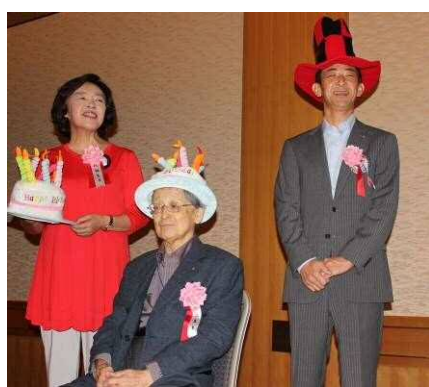
9月お誕生日月 おめでとう！