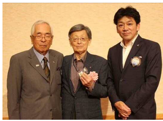
アテンダンス・アワード