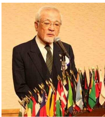
小杉 ZC 例会訪問