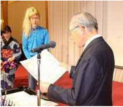
第1副会長班 『ライオンズベストパフォーマンス大賞』