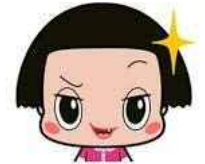
第2副会長班 『チョコちゃんに叱られる!』