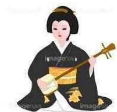
第3副会長班 『お座敷芸 三題』