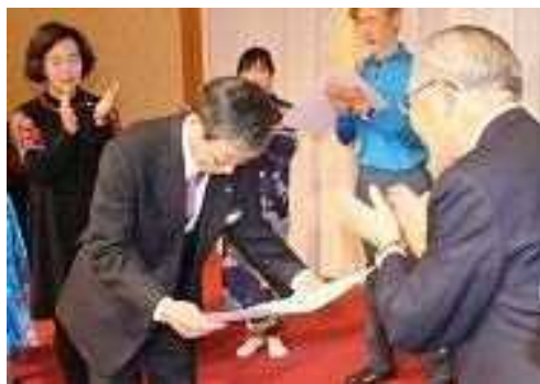
第2副会長班 『ライオンズ We Serve 大賞』