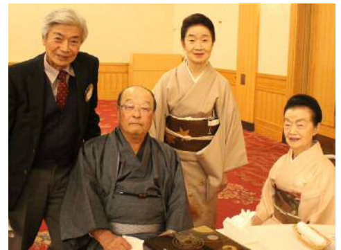
第3副会長班で盛り上げて頂きました。