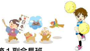
第1副会長班 『チア・アップ! 桃太郎!!』