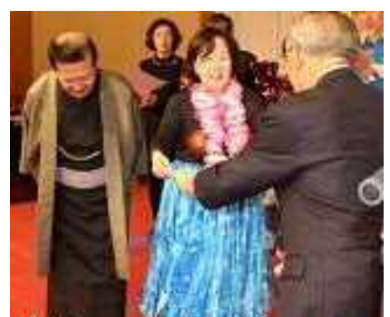
第3副会長班 『ライオンズ伝統芸能大賞』