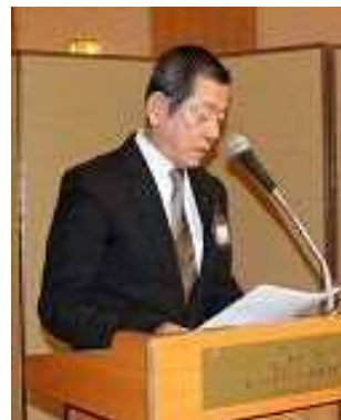
高田泉副L Tのビジター紹介