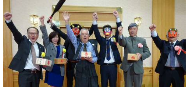
年男女による豆まきで盛り上がりました