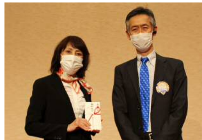
浜松ライオネット合唱団へ助成金贈呈