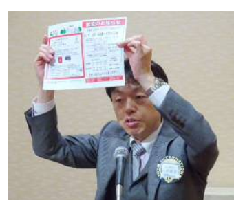
山岸保健奉仕委員長より 献血のお願い