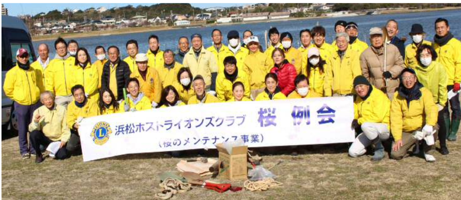
寒空の下 お疲れ様でした！