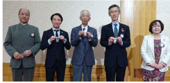
アテンダンス・アワード