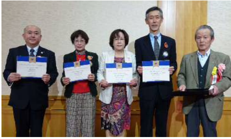
ガイディングライオン認定状贈呈