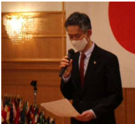
高橋会長より次期役員の発表