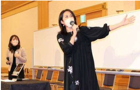
TTによるビンゴ大会大変盛り上がりました！