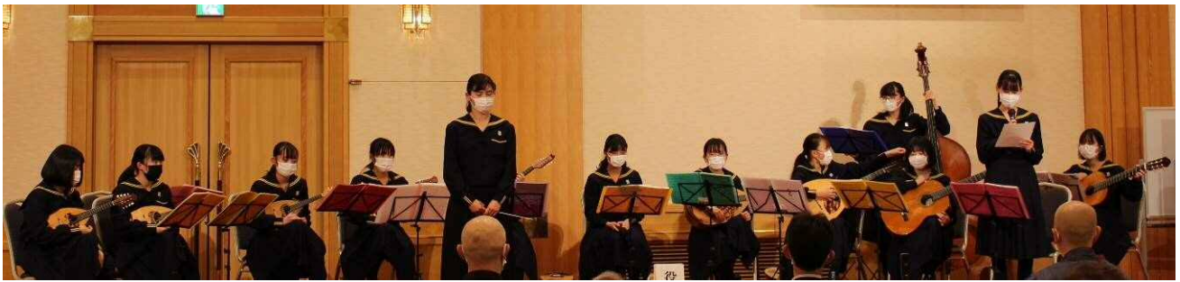
西遠女子学園ギター・マンドリン部の皆様の演奏に感動しました