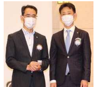
アテンダンスアワード