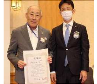
中古眼鏡収集感謝状