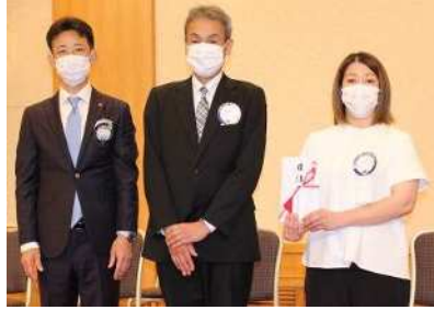
浜松視覚特別支援学校ヘライオンズ図書贈呈・校長先生ご挨拶