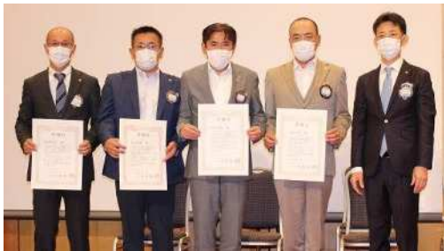
中古ランドセル収集感謝状