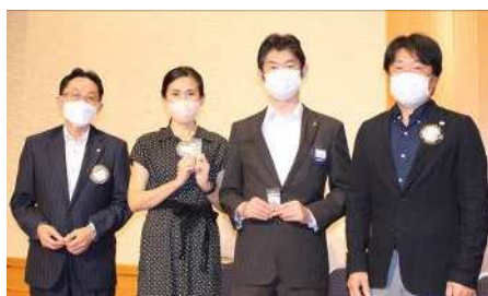
アテンダンス・アワード