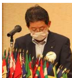
本年度予算案審議