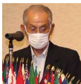
前年度会計監査報告