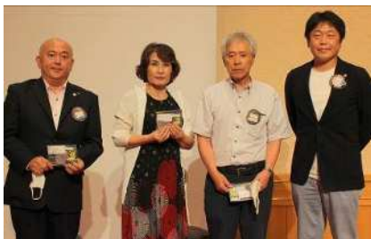
キャンペーン100アワード伝達