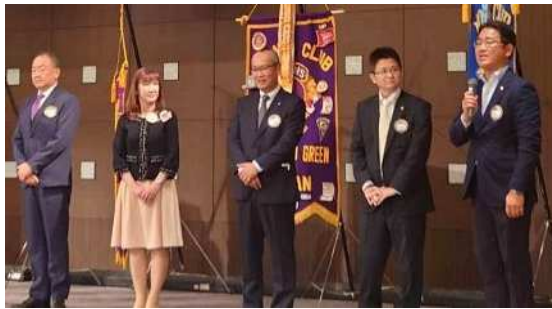
今年度入会新会員紹介