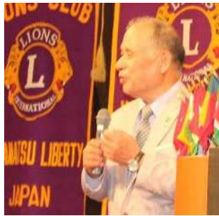
太田地区ガバナーご挨拶