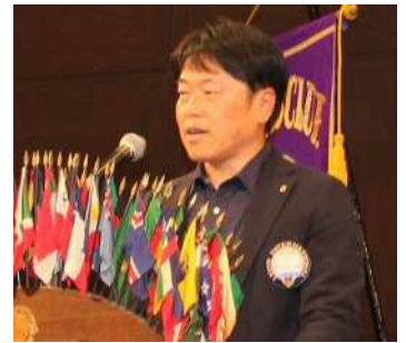
浜松LC高田会長挨拶