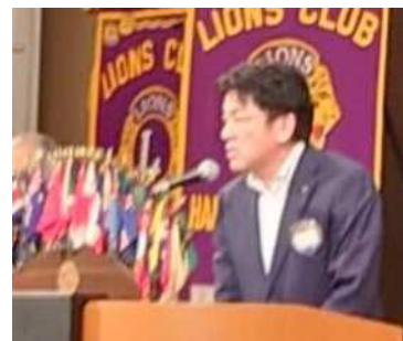
有賀次期ZC予定者によるライオンズスローア