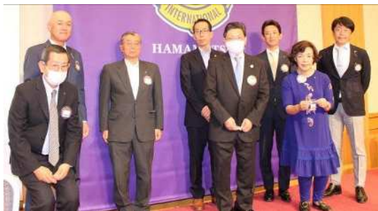
アテンダンス・アワード