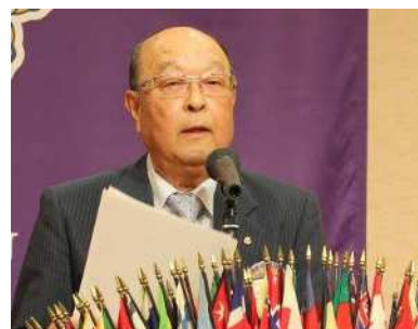
L江川メンバースピーチ「浜松LCの心」