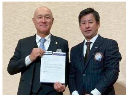
前年度会員満足度向上アワード伝達