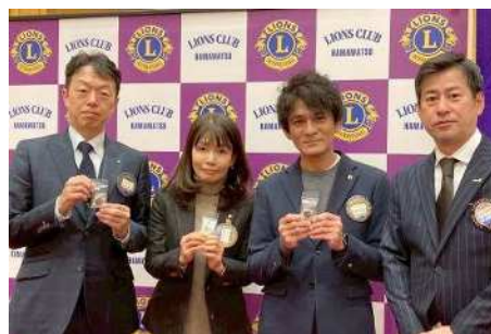
アテンダンス・アワード