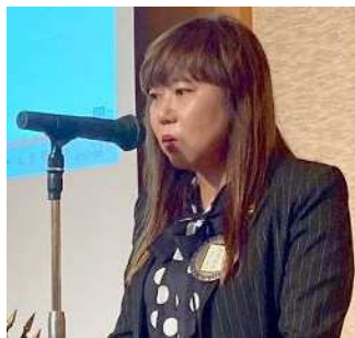
松本GST地域奉仕副委員長