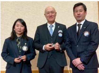
前年度クラブ優秀賞 クラブ会長・クラブ幹事賞