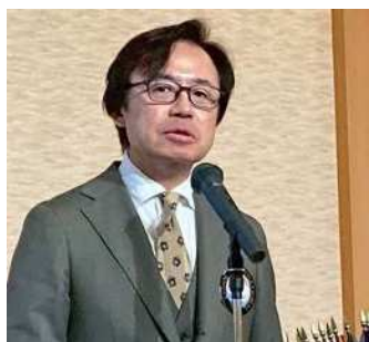
間瀬MC・L情報委員会理事