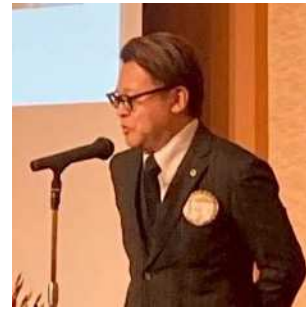
伊藤YCE国際関係委員長