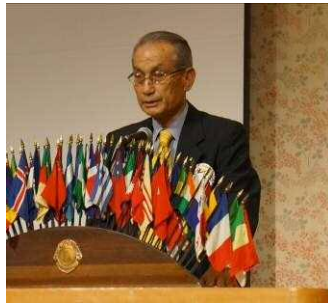
前年度会計 決算報告