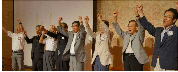
アテンダンスアワード