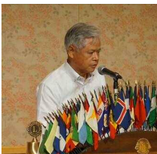
前会長決算報告審議