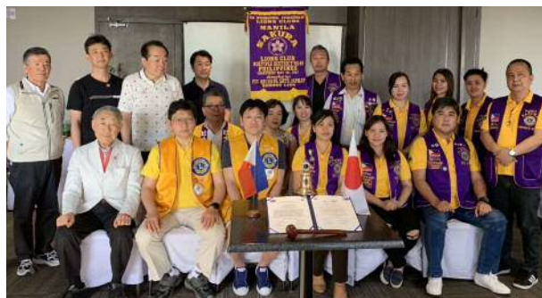
友好クラブ提携後、サクラLCと共に現地の足の不自由な方に車椅子を寄贈しました。