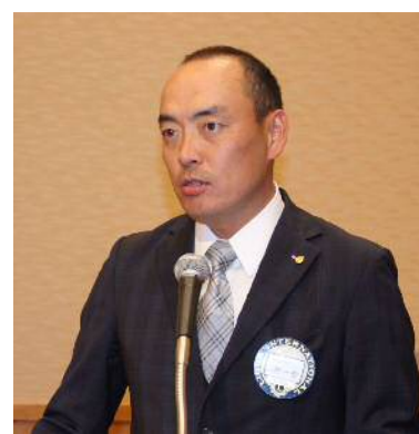
仁地副幹事による幹事報告