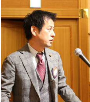
山本による講師紹介