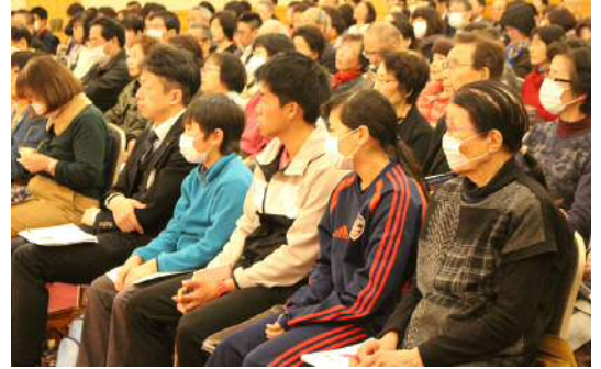
講師の講演に聞き入る聴講者