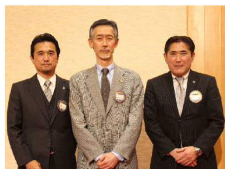
アテンダンス・アワード