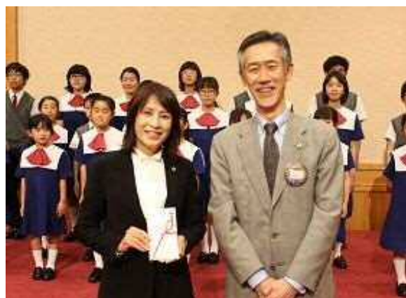
浜松ライオネット児童合唱団の皆様をお迎えして