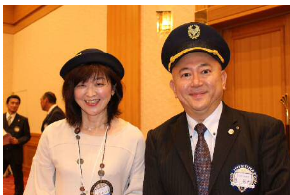
TTタイム盛り上がりました！