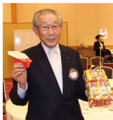
紙ヒコーキ1番遠くへ飛びました