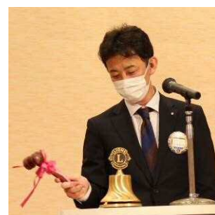
呉海第一副会長による閉会のゴング