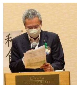
彦坂LTによるゲスト紹介