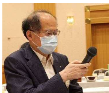
T Tタイムでの突撃インタビューにお答えるメンバー