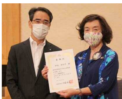
静岡県薬物乱用防止指導員委嘱状伝達