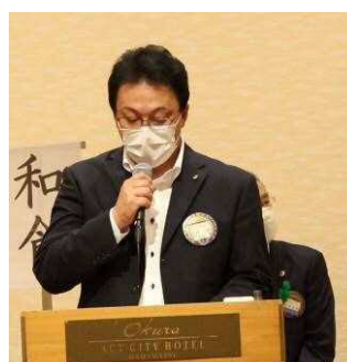
本多計画委員長による司会