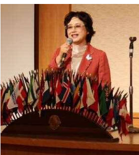
大石 ZC 例会訪問