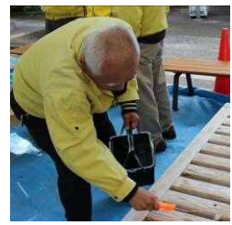
ベンチのペンキ塗り作業