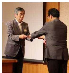
複合年次大会役員への委嘱状