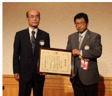
厚生大臣より献眼への感謝状