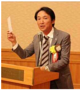
太田保健奉仕委員長より 献眼登録のお願い