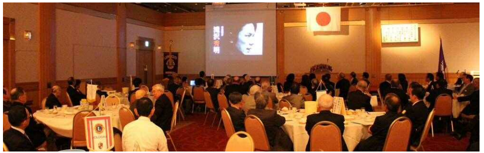
アイバンク創立50周年記念「ひかり」DVD 上映