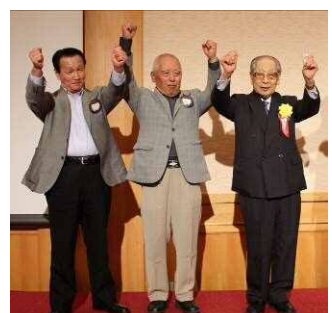
アテンダンスアワード